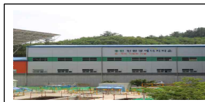
마을 도시가스 공급 (가축분뇨 가스 활용)

○ 처리시설에서 생산된 폐열·폐가스 등을 활용, 주민주도 수익사업을 추진 하는 친환경에너지타운 조성·운영 중(6개소 운영·15개소 조성중)