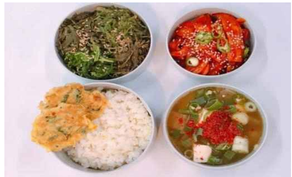
주왕산 산내음 도시락

□ (추진계획) 모든 국립공원으로 친환경 산행도시락 사업 확대에 따라 사회적경제기업 운영 확대 및 지원 강화('20~)