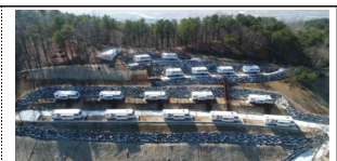
캠핑장 운영 (소각열 활용)

□ (추진계획) 처리시설의 안정적 설치·운영을 도모함과 함께, 마을 협동 조합 등 사회적경제조직을 통한 안정적인 지역 소득창출 사업 추진