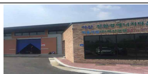
마을 세탁공장 운영 (소각열 활용)