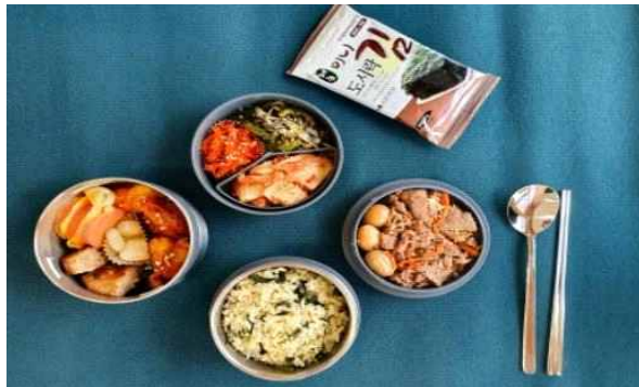
태백산 곤드레밥 정식

※ 치악산(강원만찬협동조합) : 매출액 210백만원('19), 일자리 창출('18년 2명→현재 8명)