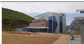
마을 사우나 운영 (가축분뇨시설 폐열 활용)